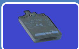
Türpositionsschalter TPS – mit verstellbarer Nocke und vergoldeten Kontakten, IP65