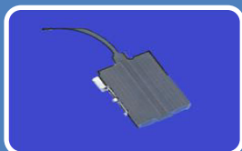
Schaltschrankheizung –AC-DC 140-240 V, 15-150W, selbstregelnd, Schutzklasse II, Schutzart IP54, Anschlußleistung 2x0,75 mm 2 x500mm, Befestigung: Clip für Hutschiene 35 mm