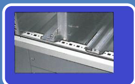
Montageplatte - verstellbar im Raster von 25 mm