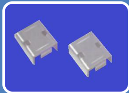
Schnellverbinder - als Montagehilfe bei der Installation