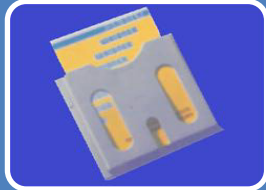
Schaltplantasche - Kunststoff TYP SPK A4