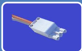
Kabel für Durchgangsverdrahtung DGV, 0,6 m orange, 3x1,5 mm 2 , mit Stecker und Buchse, Kabel für Netzanschluß NAS, 3 m orange, 3x1,5 mm 2