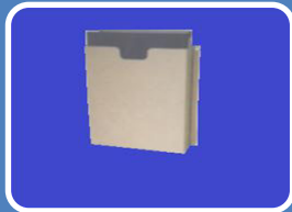
Schaltplantasche – Stahlblech TYP SPT