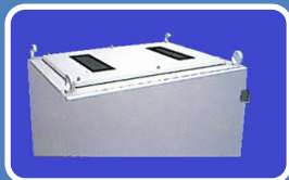
Dach – abnehmbar und vorbereitet zur Aufnahme eines Kühlgerätes